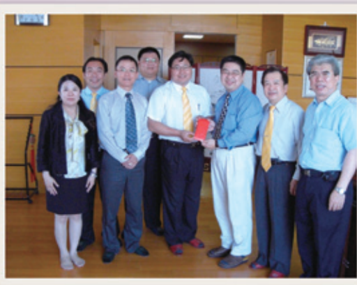
苗栗縣東南獅子會致贈清寒獎學金

在仁德醫專41年校慶的同時，除了祝福還是祝福；也希望視光科的學弟、學妹，希望你們能把握在校的每一分每一秒，好好充實自己。