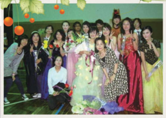
應用外語科 2007年畢業公演

仁德這個大家庭孕育了無數的莘莘學子，這些學生在校時敦品力學，畢業後也成為社會的中堅份子，無論離開學校多少年，他們的心中仍然念念不忘仁德的一草一木，還有講臺上諄諄教誨的師長們，欣逢學校生日，他們要用文字表達對學校無限的感念，也許文字樸拙無華，但內心的那份真摯情感卻悠長。