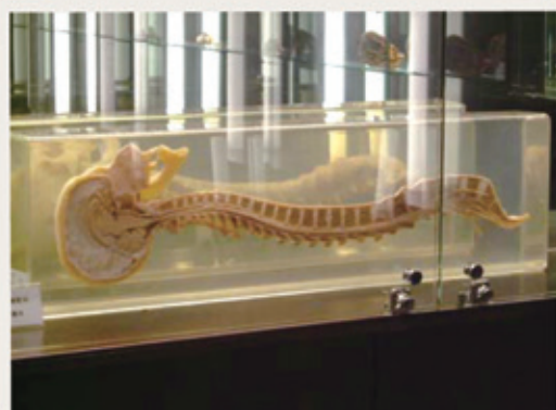
▲人體科學館一脊椎構造