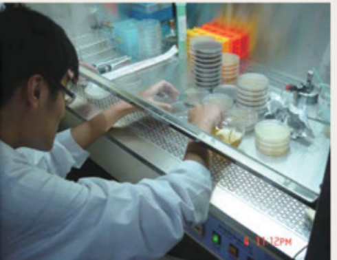
▲醫檢科-臨床微生物實驗操作